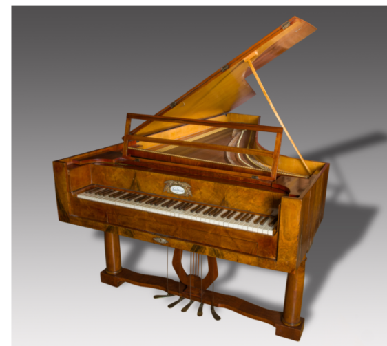
Schätzler, Vienne c1828

Durant la semaine, profitez également du cadre privilégié qu'offre Villeneuve les Avignon : village historique, fort Saint-André, et Avignon de l'autre côté du Rhône.