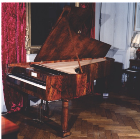
Graf, Vienne c1827