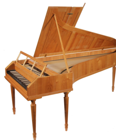
Facsimilé Stein 1786, Chris Maene