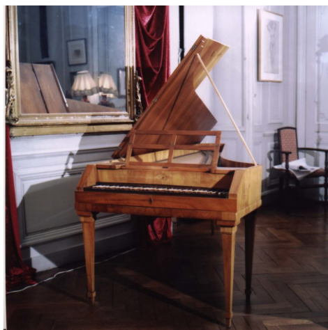
école Walter, Vienne c1795

Les journées s'organiseront en alternant cours particuliers, cours collectifs et travail en autonomie. Un concert est prévu à la fin des 4 journées. Au fil de la semaine, certains moments seront également réservés à la détente !