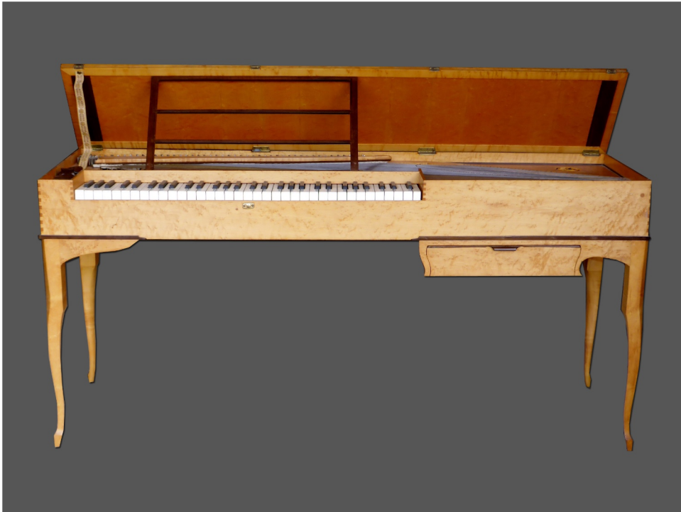
Clavichorde Haas, création, c1970

Villeneuve les Avignon est située à 9 km de la gare d'Avignon-TGV. Une navette sera organisée de la gare à l'académie. L'aéroport le plus proche est Marseille, prévoyez dans ce cas votre transport vers Villeneuve.