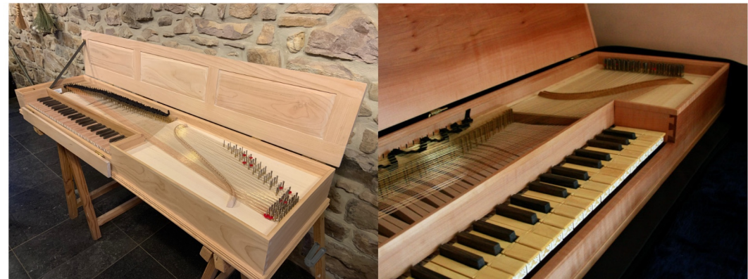
Pierre Verbeeck, d'après G. Hubert 1786